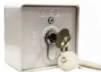
● MOD.CLIC-2PASOS (SA-00104-00)