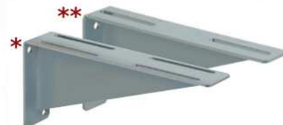
● MOD.SIDE PARA MOTOR *(EA-00080-00)