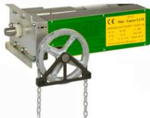
● MOD.SISTEMA MANUAL (EA-00006-00) + (EA-00056-00)