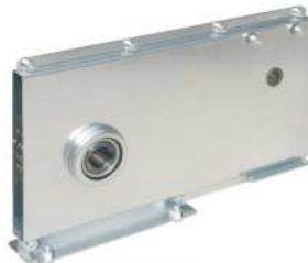
● MOD.MOTOR BRACKET (EA-00064-00)