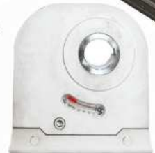
● MOD.PRB 30 (EA-00075-00)