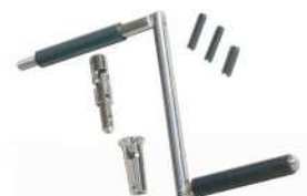
● MOD.MANIVELA (EA-00058-00)