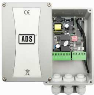
● MOD.SHUTTER 2.0 (MF-00014-00)