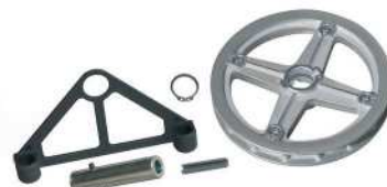
● MOD.RUEDA CADENA (EA-00056-00)