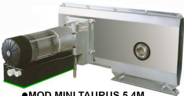
● MOD.MINI TAURUS 5.4M (EA-00006-00) + (EA-00064-00)