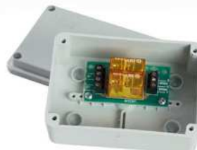
● MOD.INTERFACE MODULE (EA-00051-00)